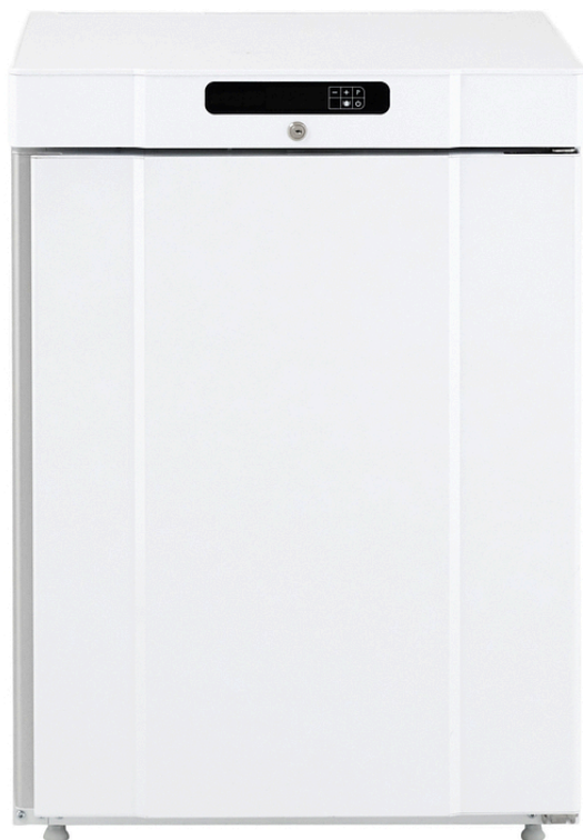
TABLE TOP NEG. BLANC